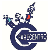
Centro per le famiglie dell'Unione dei Comuni della Bassa Romagna